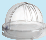
XVIVO Organ Chamber™