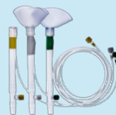
XVIVO Lung Cannula Set™