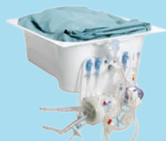
LS Disposable Kit™