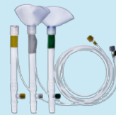
XVIVO Lung Cannula Set™