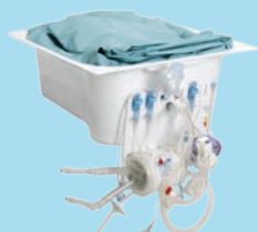
LS Disposable Kit™