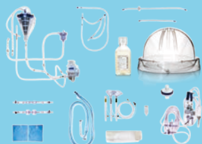
XPS Disposable Kit™