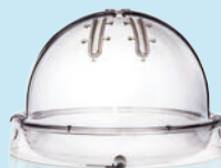
XVIVO Organ Chamber™