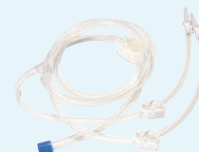
Silicone Tubing Set™